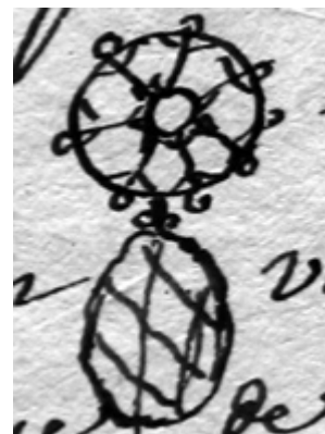
Dessin de Séguier représentant une des croix en diamants

Mode : Monsieur mon très cher amy, dès avoir reçu votre lettre, j'ai été chez M r Pierre pour conclure votre affaire pour les croix de diamans. Voici les conditions. Les croix seront de diamans brillantés, montées du dernier goût. Il vous donnera 2 mois et demy de tems pour les recevoir et les renvoyer au cas elles ne conviennent pas, et pour lors, si elles reviennent, vous perdrez 20 lt qui est le prix de la monture de l'autre et cela parce que la mode de porter des croix passe et qu'on se contente de porter simplement une petite rose de diamans, faite à peu près de cette facon, mais ces sortes d'ornemens excèdent de beaucoup le prix que vous vouliez y mettre et il n'y a point eu d'autre party à prendre que de faire des croix. (juin 1735)